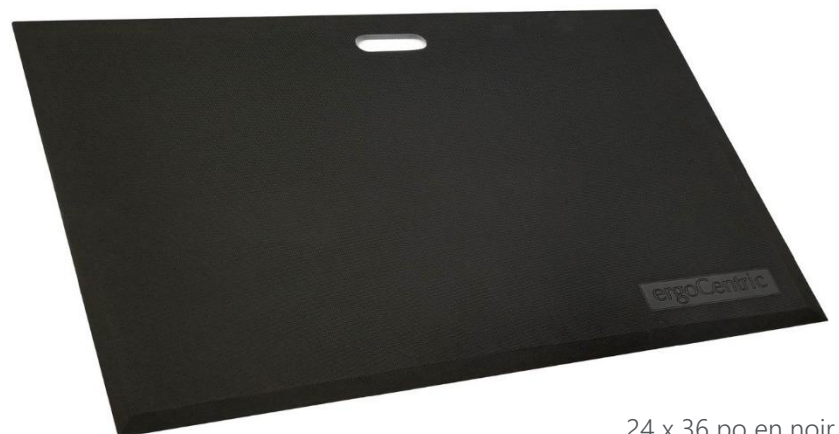
24 x 36 po en noir